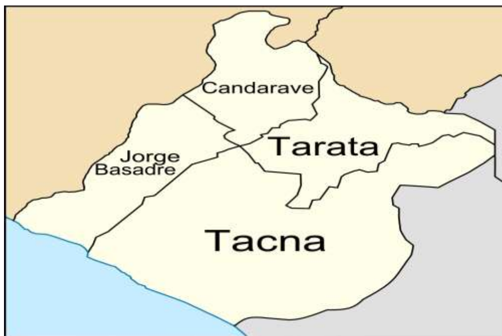
Figura 1 Región de Tacna