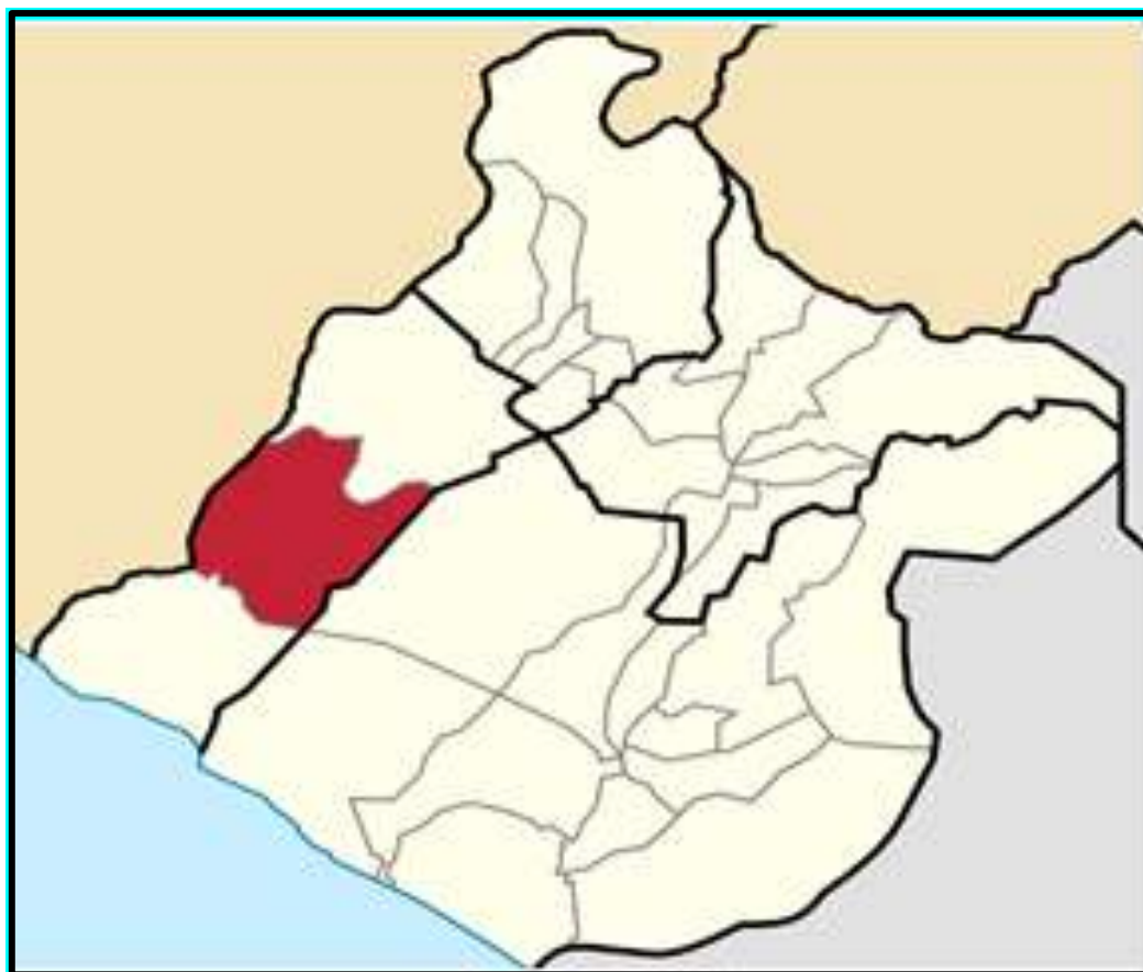
Figura 3 Distrito de Locumba