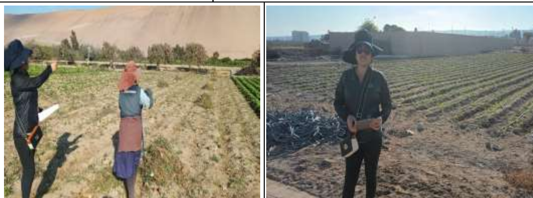
Visita a campo - Distrito Yarada Los Palos