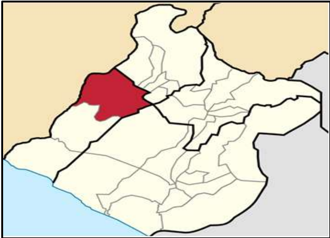
Figura 4 Distrito de Ilabaya