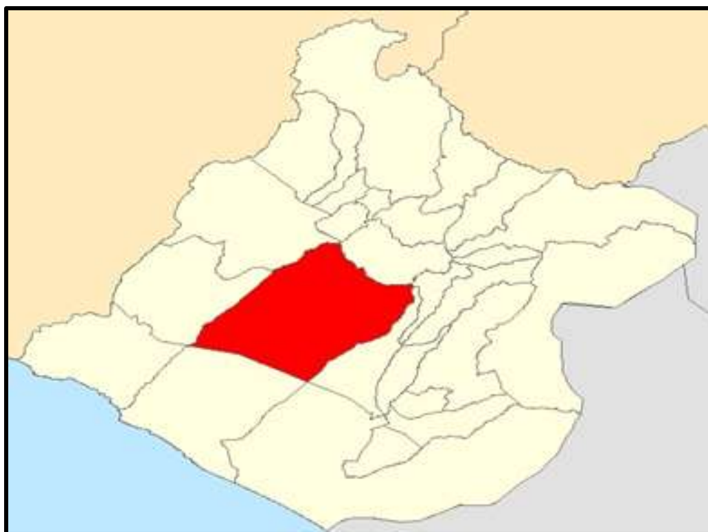
Figura 2 Distrito de Inclán