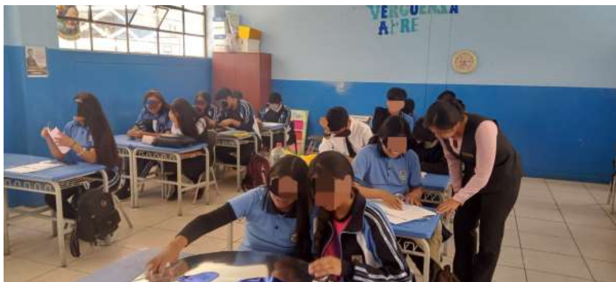
Ilustración 2.- Desarrollo de la clase con los estudiantes