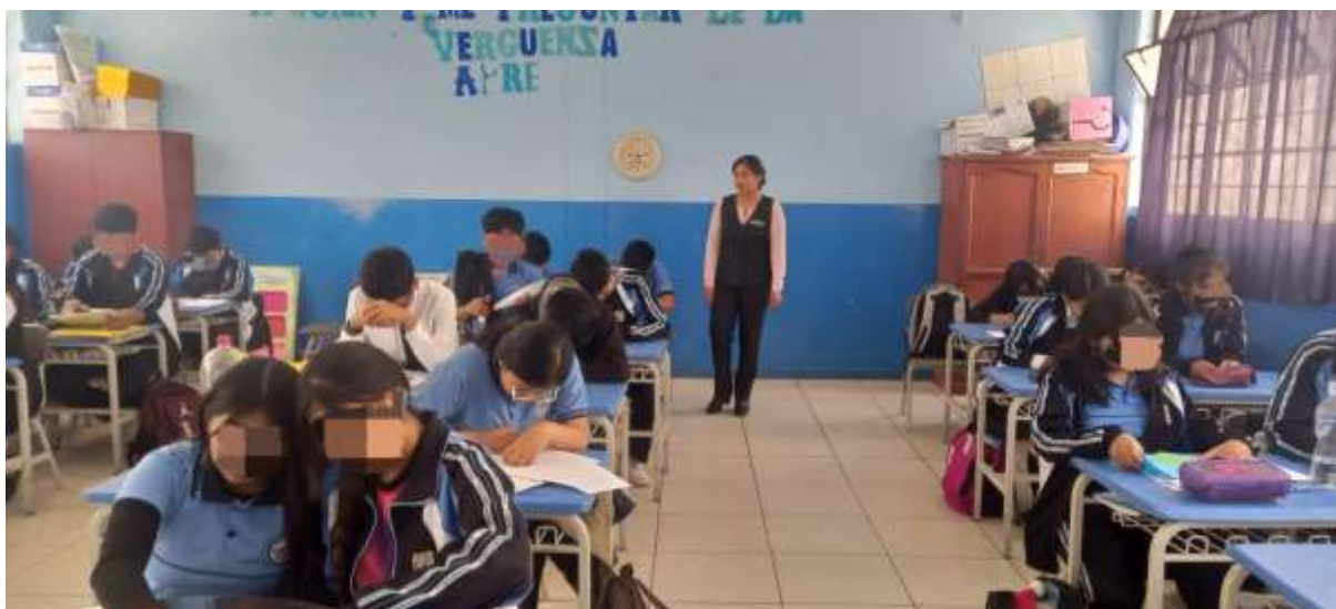
Ilustración 3.- Desarrollo de las clases con los estudiantes