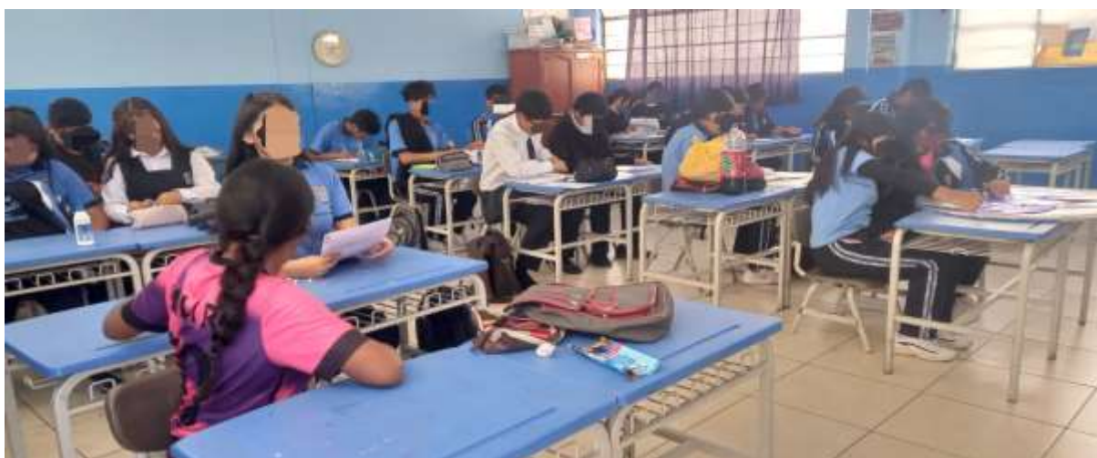
Ilustración 4.- Desarrollo de las clases con los estudiantes