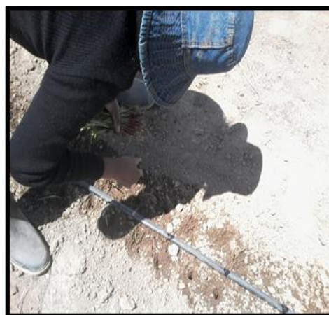
Figura 2. El transplante a campo definitivo. Tacna 2015