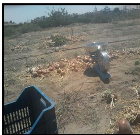
Figura 4. La cosecha. Tacna 2016