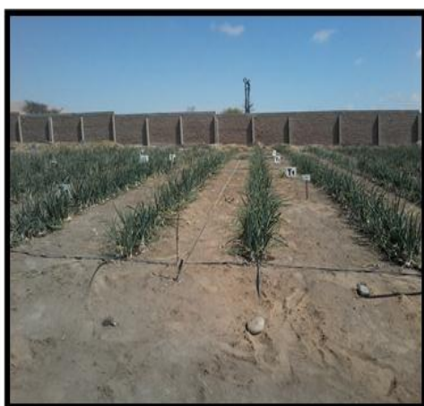
Figura 3. Campo con tratamientos designados. Tacna 2015