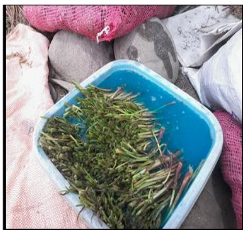
Figura 1. Desinfección de plántulas de cebolla. Tacna 2015