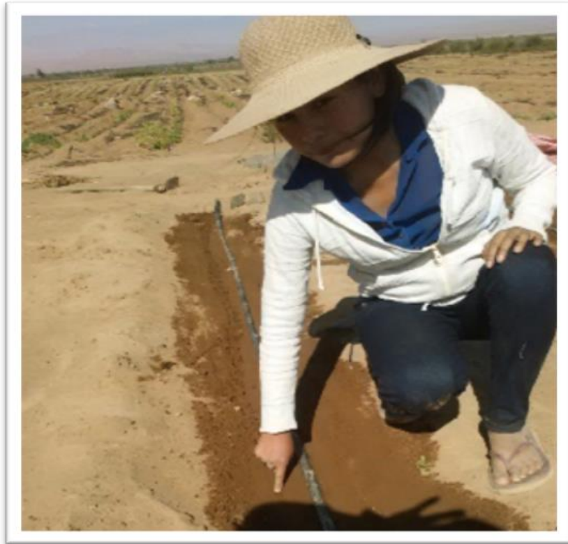
Fotografía 02: Siembra