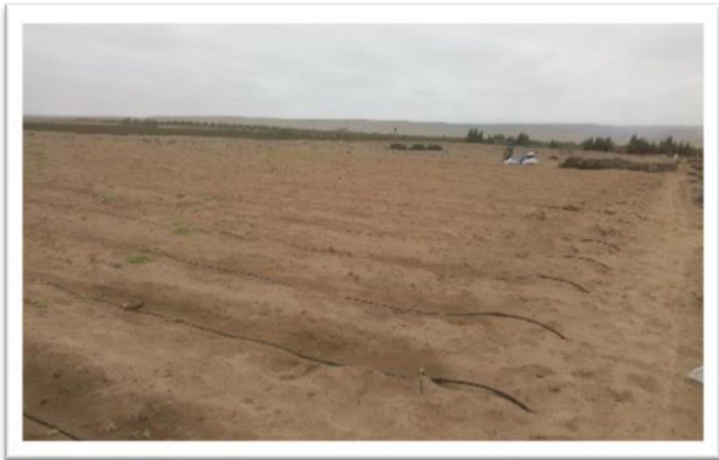
Fotografía 01: Preparación del terreno