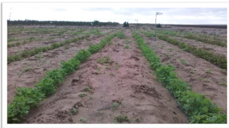
Fotografía 05: Desmalezado del cultivo