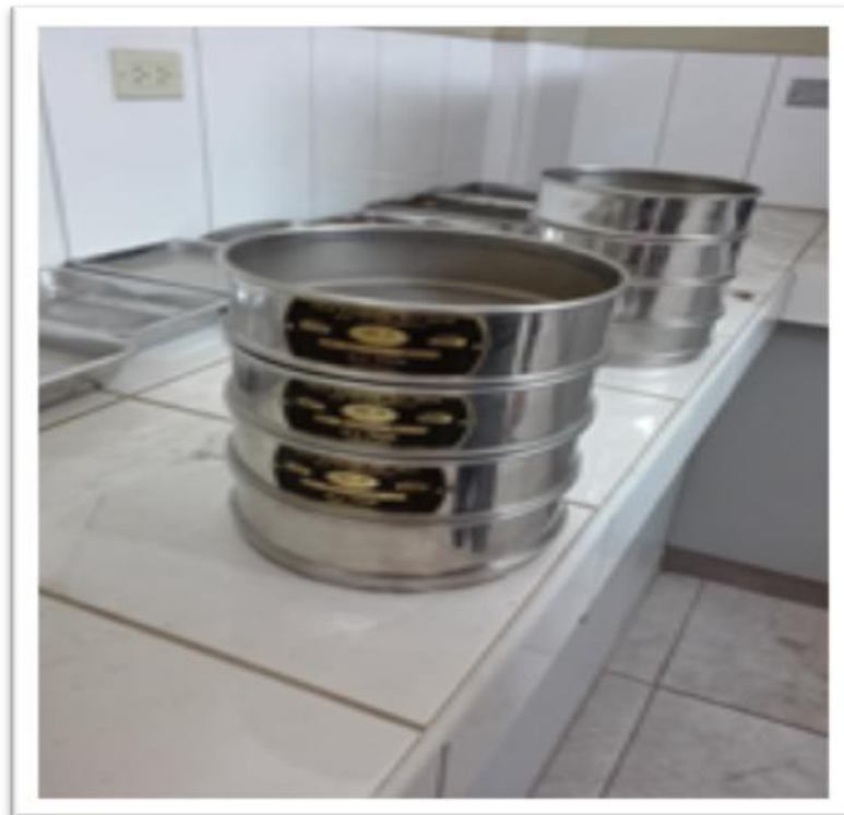
Fotografía 11: Tamaño de grano