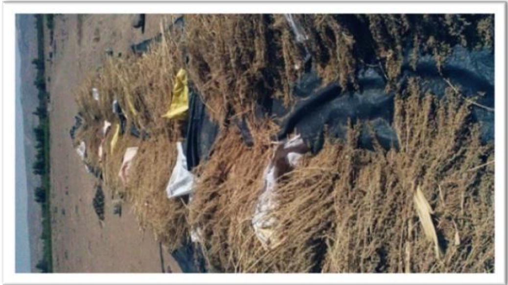
Fotografía 08: Cosecha de la quinua