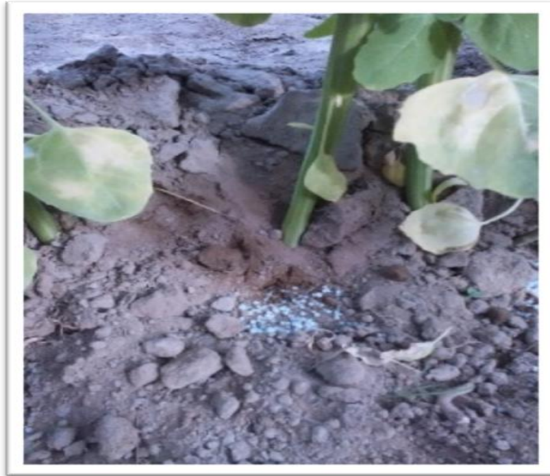
Fotografía 04: Fertilización