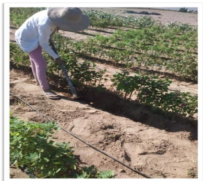
Fotografía 07: Aporque del cultivo