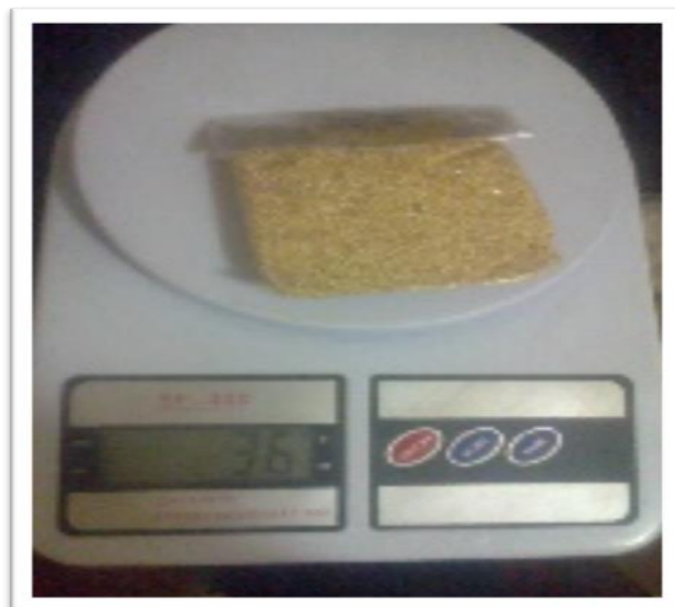
Fotografía 09: Toma de datos (peso de grano)