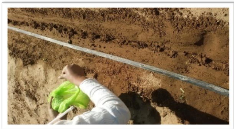
Fotografía 03: Abonado de fondo