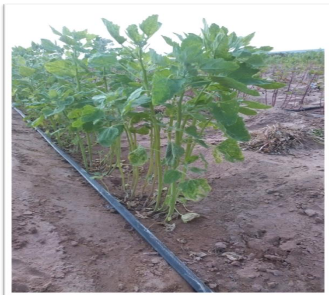
Fotografía 06: Raleo o entresaque