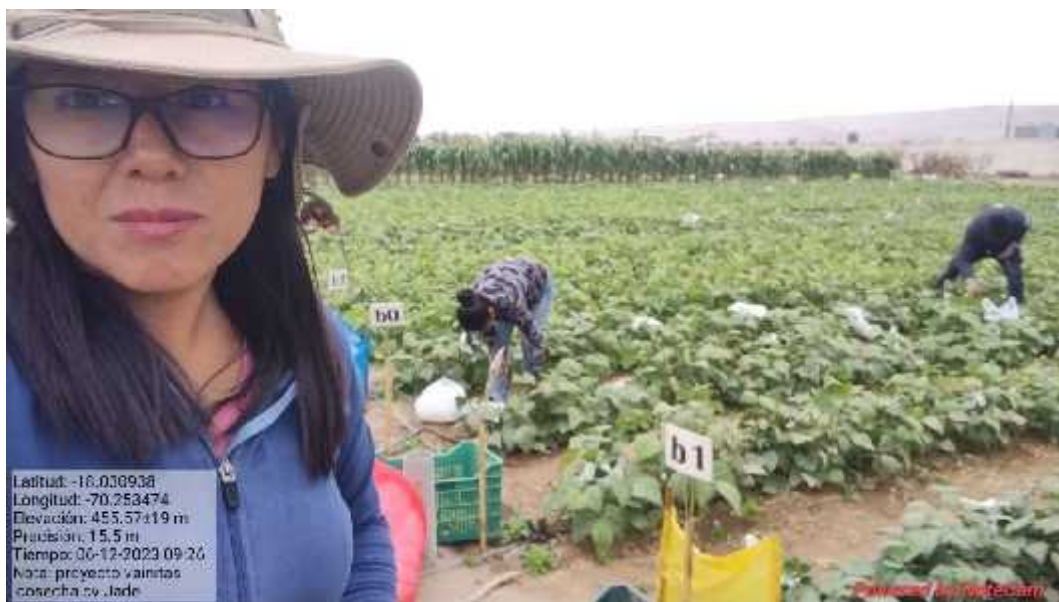
Fotografía 5. Cosecha de vainita