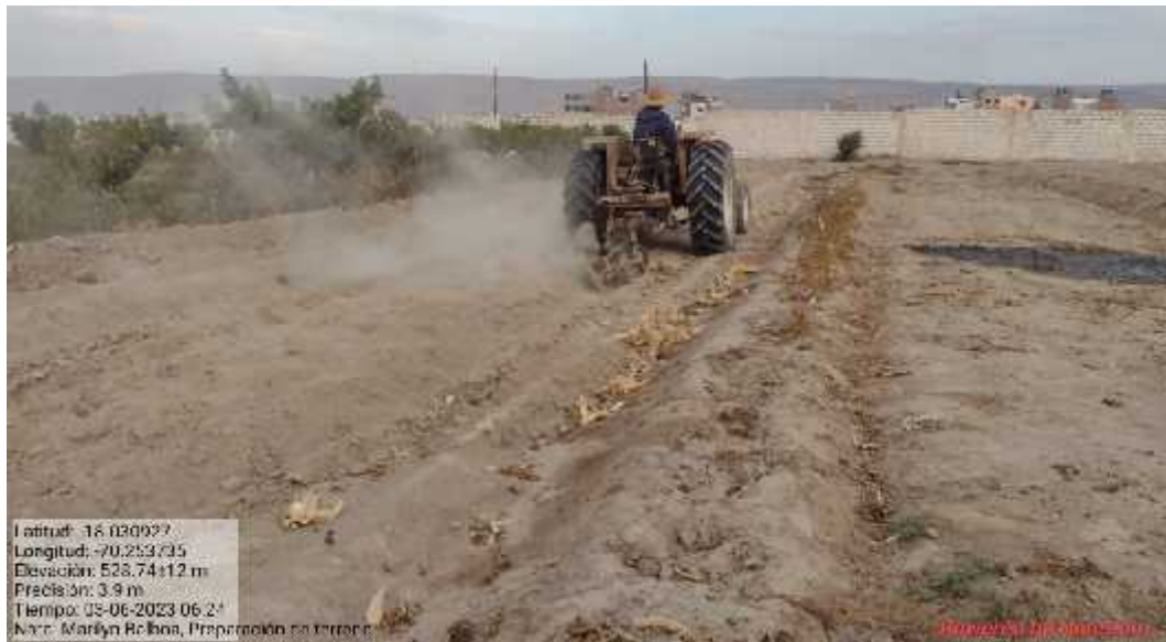
Fotografía 1. Preparación de terreno