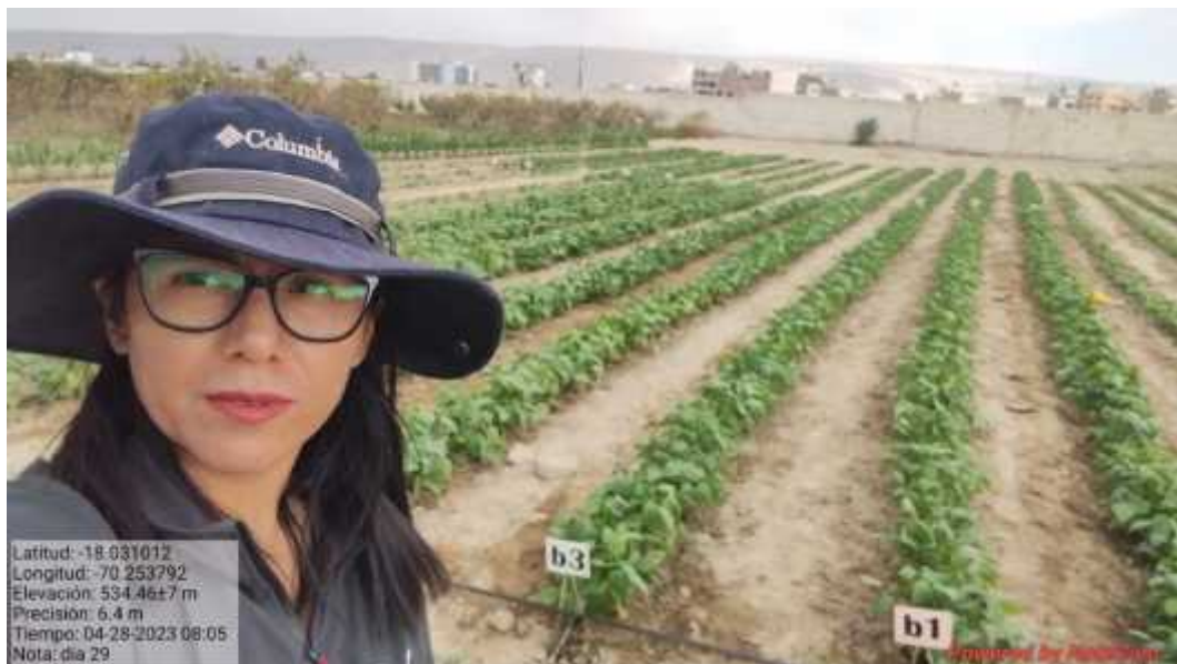
Fotografía 2. Crecimiento y desarrollo vegetativo