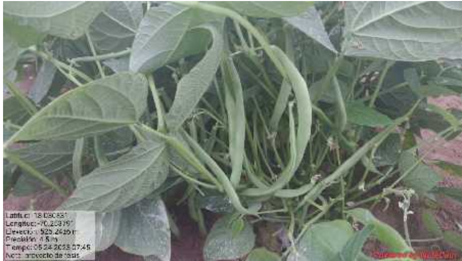
Fotografía 3. Vainitas cv. Magnum