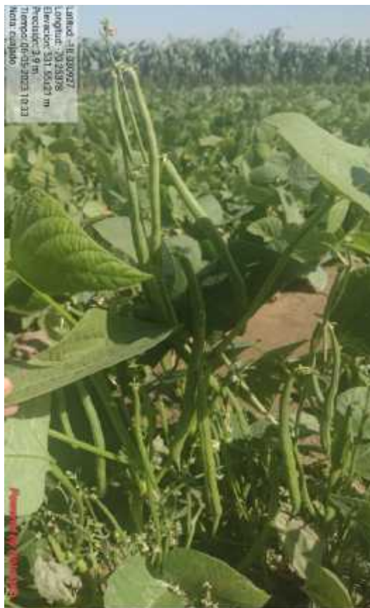
Fotografía 4. Vainitas cv. Jade