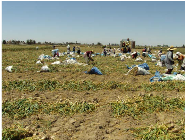
Fotografía N° 8: Cosecha de cebolla roja realizado en los meses de febrero, marzo y a veces se alarga hasta abril.