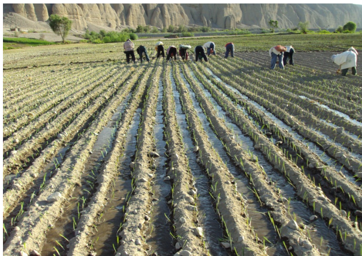
Fotografía N° 5: El trasplante realizado en dos hileras de cebolla roja y a la vez se realiza el regado

A campo definitivo, se realiza en suelo seco, que se riegan en el mismo momento del trasplante. Se marca en el costado de los surcos confeccionados a 37 cm, cada planta a 8 a 10 cm de distancia una de otra; de tal forma que en un surco hay dos hileras de cebolla como lo muestra la fotografía N° 5 a continuación: