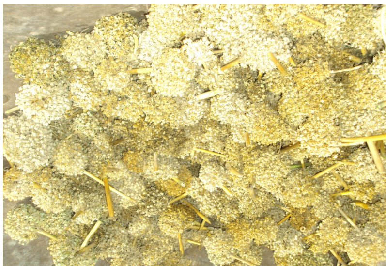
Fotografía N° 1: Semillas de cebolla roja expuestas al sol en Mirave