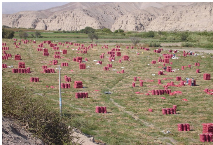
Fotografía N° 9: cebollas encostaladas lista para ser comercializada