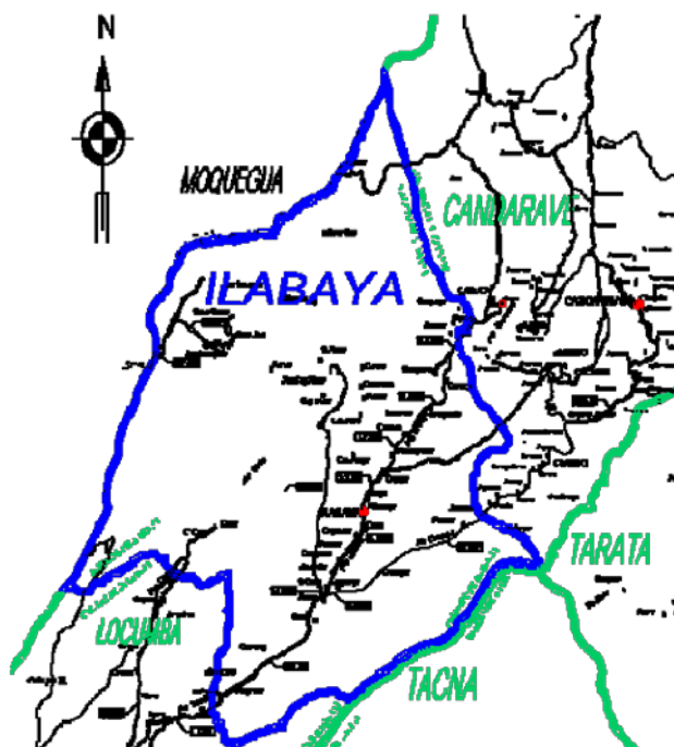
Gráfico N° 3: MAPA DE UBICACIÓN EN LA ZONA DE INTERVENCIÓN