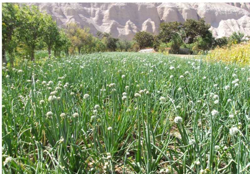
Fotografía N° 3: Plantación de cebolla en pleno florecimiento